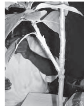
Photo 18 : Soudure réussie du greffon sur le porte-greffe 45 jours après greffage

Si les opérations sont bien suivies, voici un exemple de plant que l'on obtiendra très bientôt !