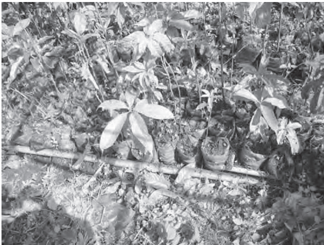
Photo 20 : Protection des jeunes plants contre les mauvaises herbes