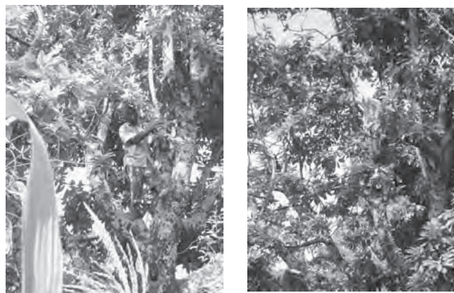
Photo 11 : Récolte des portes greffes dans un grand arbre de semis

On conseille de prélever des greffons sur des sujets présentant les caractéristiques de la variété désirée, et suffisamment vigoureux. Les zones de collecte sont les rameaux normalement développés sur une branche bien éclairée. On doit toujours connaître les qualités que renferme ce fragment de plant. Pour se faire, on prélève les greffons sur un arbre déjà en production pour s'assurer du caractère que l'on veut conserver. Parfois, on peut même aller chercher ces fragments très loin. Il arrive aussi pour obtenir des greffons intéressés de grimper sur l'arbre. Donc prudence !