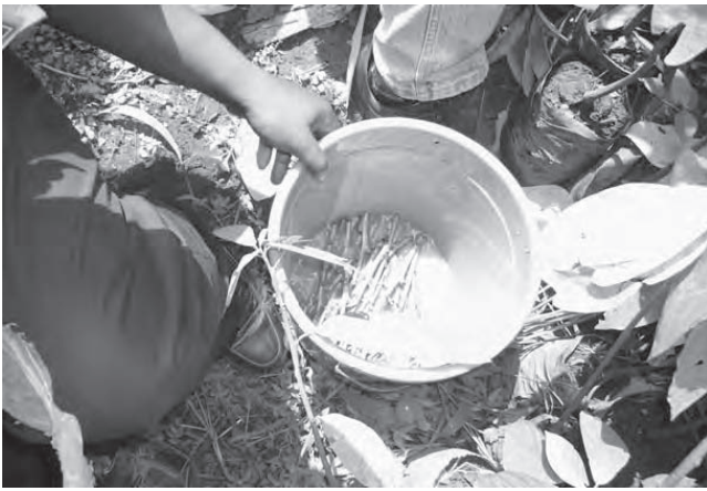
Photo 15 : Traitement préventif des greffons contre les attaques des champignons

On procède à l'entaille (fente de côté) sur le porte greffe. Enfin, on fait pénétrer le greffon sur la portion entaillée du porte greffe, puis, on ligature le cal (zone de contact entre greffon et porte greffe) tout en prenant soin de ne pas couvrir les « yeux » (bourgeons dormants) du greffon. On protège également le greffon en l'enveloppant avec du papier nylon pour le maintenir à une température constante et empêcher l'infiltration d'air et d'eau.