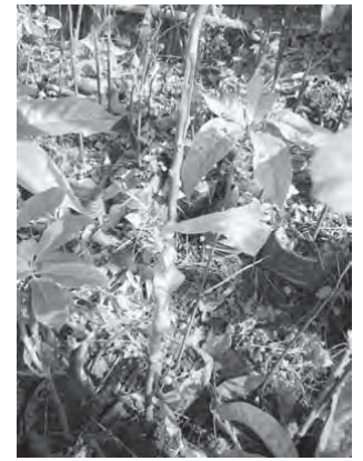
Photo 17 : Méthode de ligature/soudure du greffon sur le porte-greffe

Si les opérations sont bien suivies, voici un exemple de plant que l'on obtiendra très bientôt !