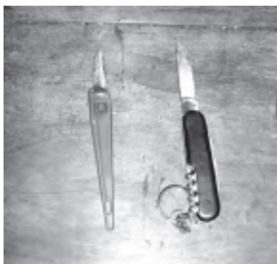
Photo 2 : Un greffoir original et un autre adapté d'un couteau suisse

A l'extrême, pour des quantités négligeables certains utilisent des lames de rasoir. Mais elles perdent rapidement leur capacité coupante et risquent de blesser le manipulateur.