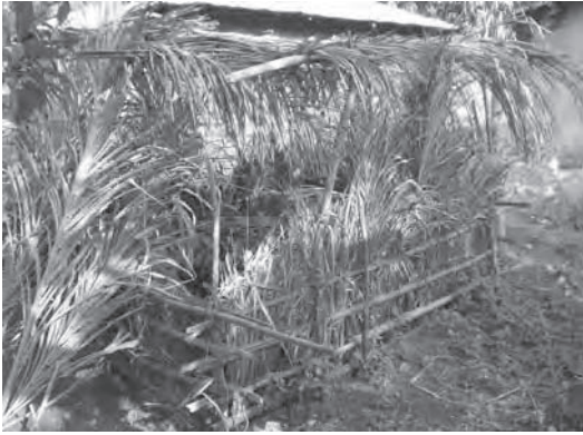
Photo 19 : Protection de la pépinière contre les animaux domestiques