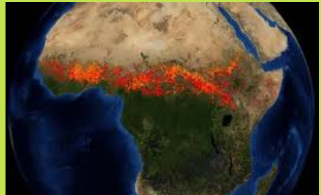
PHOTO SATELLITAIRE DES FEUX DE BROUSSES DE LA NASA EN 2002

Prisonniers d'habitudes ancestrales, beaucoup d'agriculteurs sahéliens ne savent pas cultiver sans nettoyer leurs champs par le feu, convaincus que seule cette technique est possible. Cela illustre bien toute la difficulté de l'encadrement technique des cultures traditionnelles. Mais ces cultures traditionnelles représentent la ressource principale du monde rural sahélien (80 % de la population) que ni les cultures d'exportation, ni les cultures irriguées ne pourront remplacer pour durablement subvenir aux besoins du Sahel. Nous nous appliquons donc à faire découvrir aux paysans des alternatives aux pratiques traditionnelles devenues inadaptées au contexte environnemental actuel. Parmi ces techniques (zaï, lutte contre les feux de brousse et l'écobuage, compostage, embocagement, agroforesterie, rotation culturale), nous allons décrire la technique du compostage développée par la FPG. Vu le rôle joué par l'humus dans le sol (vie microbienne, alimentation de la plante, rétention de l'eau, structure du sol), le compostage est essentiel pour la pérennisation du système agricole. Il est donc important de protéger et de faciliter ce processus naturel. Nous le faisons de 2 manières : le compostage au sol et le compostage en tas.