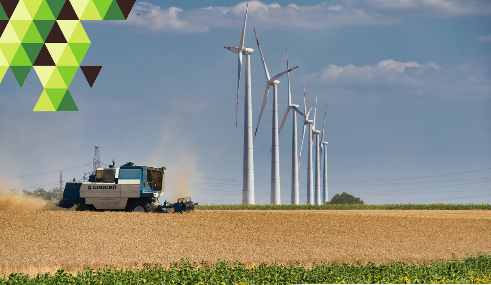
L'éolienne, une énergie renouvelable alternative aux énergies fossiles