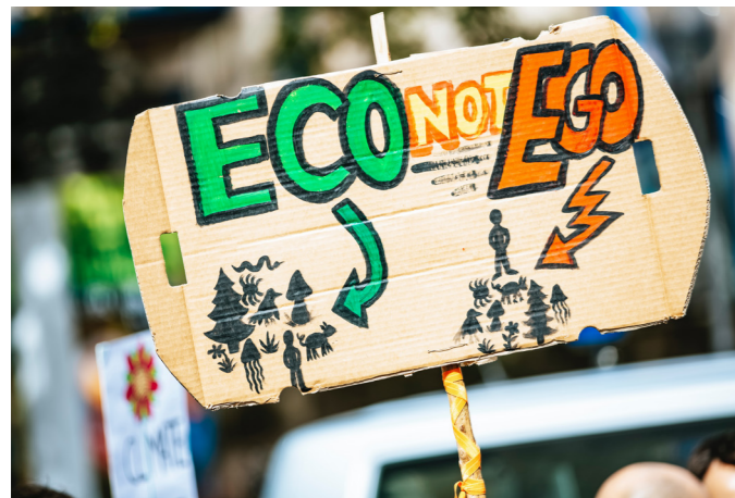
L'écoresponsabilité, c'est aller contre l'ego de l'humain, aller à l'encontre de la destruction de la planète; Photo: Markus Spiske

restauration de la couche d'ozone, montrent bien que l'on peut bien envisager et réussir un développement plus soucieux de la protection de l'environnement. L'humanité doit désormais s'inscrire dans une dynamique de développement durable en mettant l'homme et la nature au cœur de tout processus de développement tout en tenant compte des générations futures.