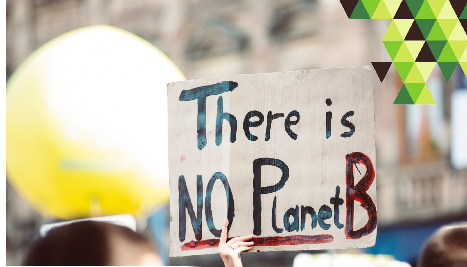
Une manifestation pour la protection de l'environnement

JURISTE AU MINISTÈRE DE L'ENVIRONNEMENT DE L'ÉNERGIE DE L'EAU ET DE L'ASSAINISSEMENT DU BURKINA-FASO