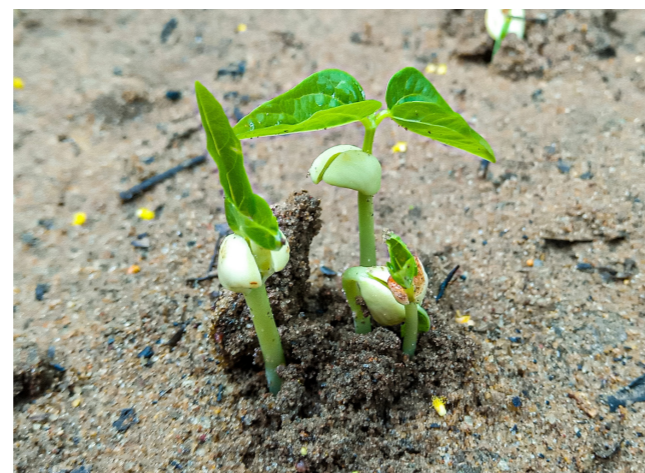
Planter des arbres, c'est bien. S'assurer de leur bonne croissance, c'est encore mieux.

Une chose plus importante encore: la durabilité. Autant il est important de poser des actes concrets en faveur de l'environnement, autant il est nécessaire d'œuvrer à leur pérennisation. A quoi sert-il par exemple de faire du reboisement sur une petite superficie sans entretenir le domaine et que ces plants soient détruits quelques mois après? Parfois, certaines organisations, des